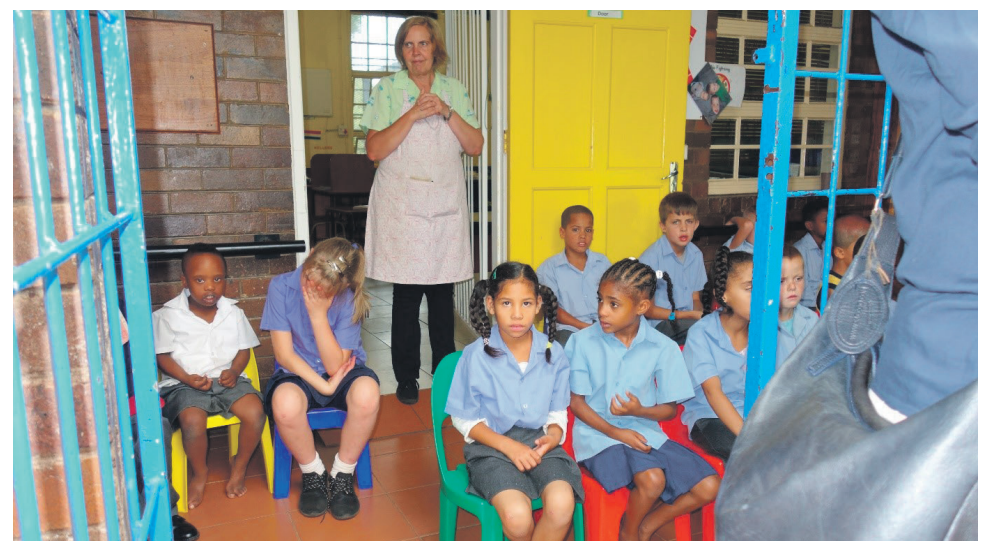
Leerlingen van het CTC.