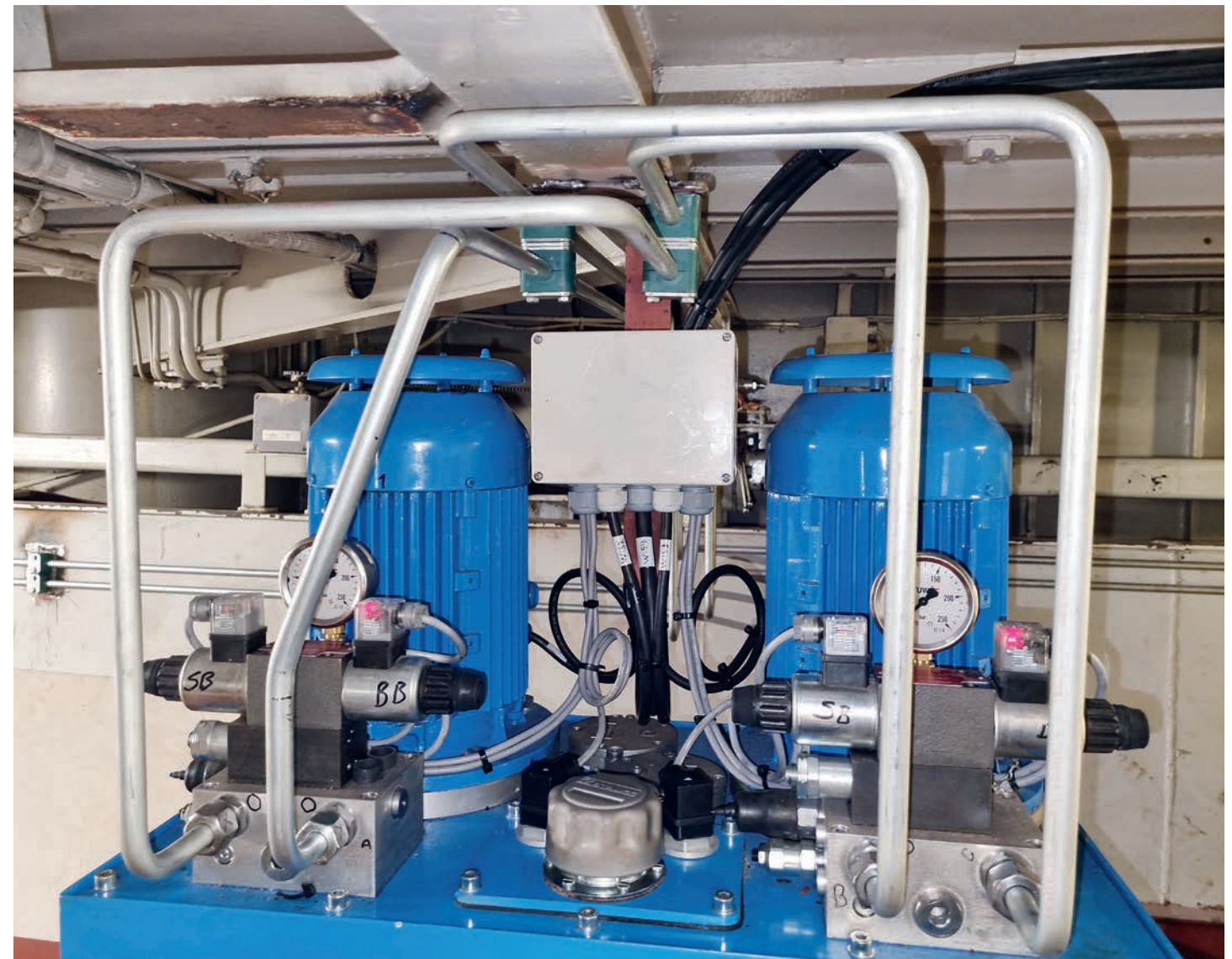
De nieuwe tankset voor de stuurmachine aan boord van de KG 8.

De Waal is onder meer een belangrijke toeleverancier aan de schepen die bij Padmos afgebouwd worden. Onlangs heeft de nog in aanbouw zijnde scheldierkotter KG 8 voor Bout een installatie (roeren, stuurmachine en tankset) van De Waal gekregen. „Kortom, het totale plaatje.”